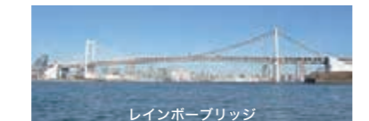
レインボーブリッジ