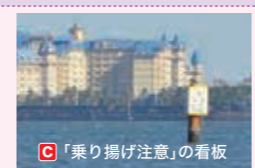
C 乗り揚げ注意の看板