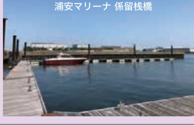
浦安マリーナ 係留棧橋

食事処 レジャー 宿泊 SPA&HOTEL「舞浜ユーラシア」 (浦安マリーナから 徒歩5分) 温泉はもちろん、ベイエリア随一の眺望を満喫しながらお食事やディナータイムが楽しめます。日帰りでも宿泊でも、思いっきり舞浜リゾートの贅沢なひと時を過ごせます。 特典: レストランご利用の場合、入館料無料 ※ 通常は、入館料を支払わないと入館不可。 www.my-spa.jp HOTEL ☎ 047-351-4139 SPA ☎ 047-351-4126