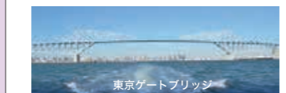
東京ゲートブリッジ