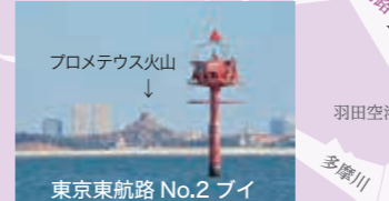
プロメテウス火山 東京東航路 No.2 ブイ