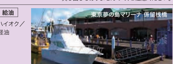
東京夢の島マリーナ 係留棧橋

陸電・水道 ※注) ・利用可能ですが、ケーブル、ホースは無し。 ・貸し出しもありませんので、ご注意ください。