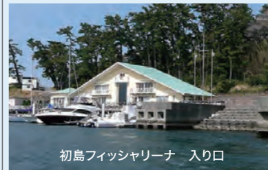
初島フィッシャリーナ 入り口