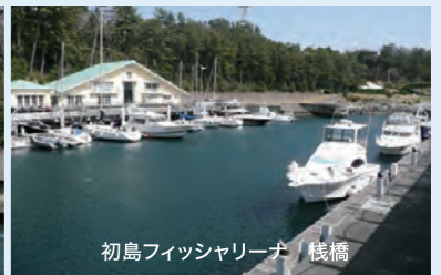
初島フィッシャリーナ 桟橋